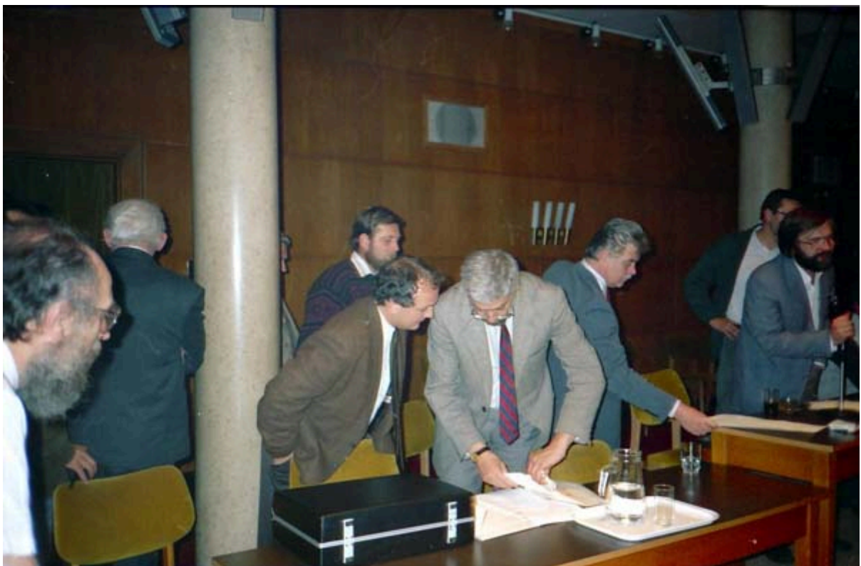
Baka Andrásnak mutat egy röplapot a belügyminiszter

Október 28, vasárnap. Szabó Győző , a Vas megyei Bíróság elnökéből lett országos rendőrfőkapitány éjfél felhívása nyomán enyhült a blokád, néhány helyen megszüntették az útlezárásokat. Az intézkedésre a kormány és a fuvarozók előzetes megállapodása alapján került sor. A Munkaügyi Minisztériumban délben megkezdődött az Érdekegyeztető Tanács ülése, melyet az MTV élő adásban közvetített. Orbán István , a Magyar Gazdasági Kamara alelnöke elnökölt, a munkavállalók küldöttségét Forgács Pál , a Szakszervezeti Kerekasztal és a FSZDL elnöke, valamint Nagy Sándor , az MSZOSZ elnöke, a munkaadóké Palotás János , a Vállalkozók Országos Szövetségének elnöke (MDF-es országgyűlési képviselő) vezette. A kormány meghatározó tárgyaló személyiségei: Bod Péter Ákos, Rabár Ferenc és Szabó Tamás.