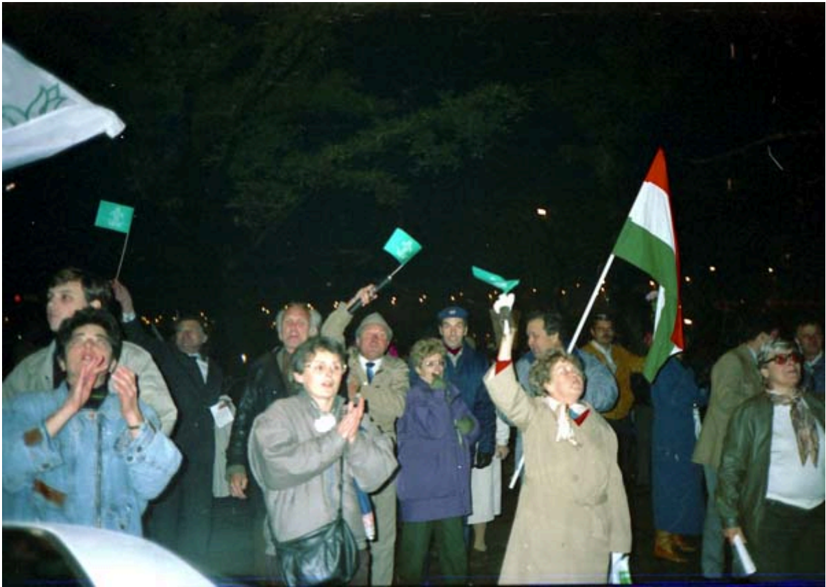
Erőre erővel válaszoltak

Estére megszületik a megállapodás. Október 29-én 12 forinttal csökkentik a megemelt benzinárakat, amelyek az árliberalizálással összefüggő törvények hatályba lépéséig érvényesek. A kormány ígéretet tett, hogy a demonstráció részt vevőit nem vonják felelősségre.