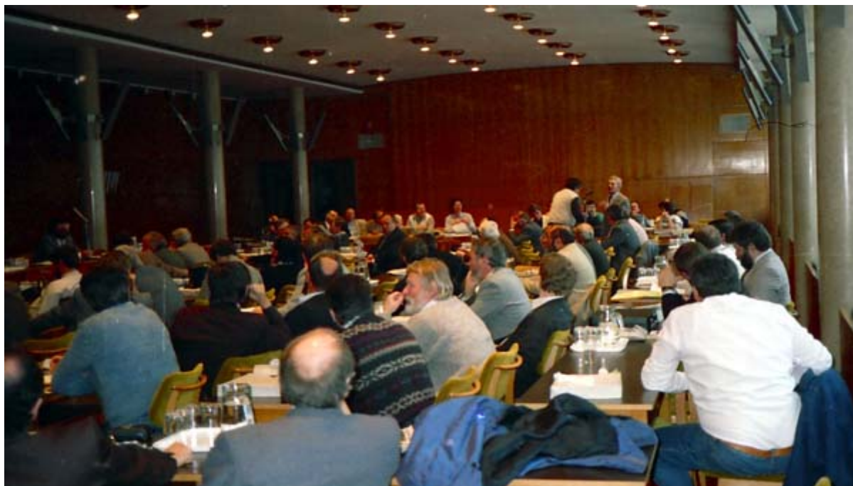
Ahol az MSZMP KB tartotta üléseit

Az 1990. október 25-28 közötti három és félnapos úgynevezett taxisblokádnak - helyesebben: a rendszerváltásban csalódottak népi elégedetlenségének - két utolsó döntő napján: 27 és 28 -án, szombaton és vasárnap folyamatosan ülészttek az MDF parlamenti képviselőcsoportjának azon tagjai, akik a közlekedési nehézségek ellenére feljutottak a fővárosba. A 165 képviselőből 110 -en. Az országot átmenetileg megbénító drámai napokban valóságos főhadiszállássá alakult át a "Fehér Ház", az Országgyűlési Képviselők Irodaháza. Az MDF nagy létszámú képviselőcsoportjának befogadására egyetlen tanácskozó terem volt alkalmas: az első emeleti, amelyben korábban Kádár János elnökletével az MSZMP egykori Központi Bizottsága tartotta üléseit. A rossz emlékek miatt azonban megváltoztatták az elnökség helyét és megfordították a széksorok irányát.