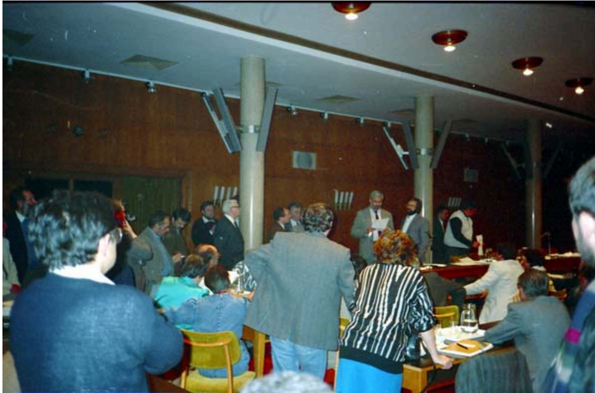
Frissen érkezett jelentést olvasnak fel

vagyontárgyakkal való megváltása, majd mikor ez gyakorlatilag kivihetetlennek bizonyult – aláírásra nem volt felhatalmazása a delegációnak - , a bankárok hunyorítottak egyet: „ Sebaj fiúk, majd megszerezzük más úton, de az adósságot pontosan fizessétek! ”, s ezzel az intéssel útjára bocsátották az Antall-csapatot. Antall beletörődött a megváltoztathatatlan tartott döntésbe, nem voltak közgazdasági ismeretei, hallgatott az üzenetre. Ezután szó sem lehetett adósság elengedésről, annak enyhítéséről, reprivatizációról, a nemzeti erőforrások népi tulajdonba helyezéséről, ellenkezőleg, megkezdődött a nemzeti termelőtőke és vagyon olcsó kiárúsítása, a multi-és transznacionális vállalatok piacvásárlása. S a szegény Magyarország fizetett mint egy katonatiszt, míg csak be nem zárult mögötte az adósok börtönének kapuja.