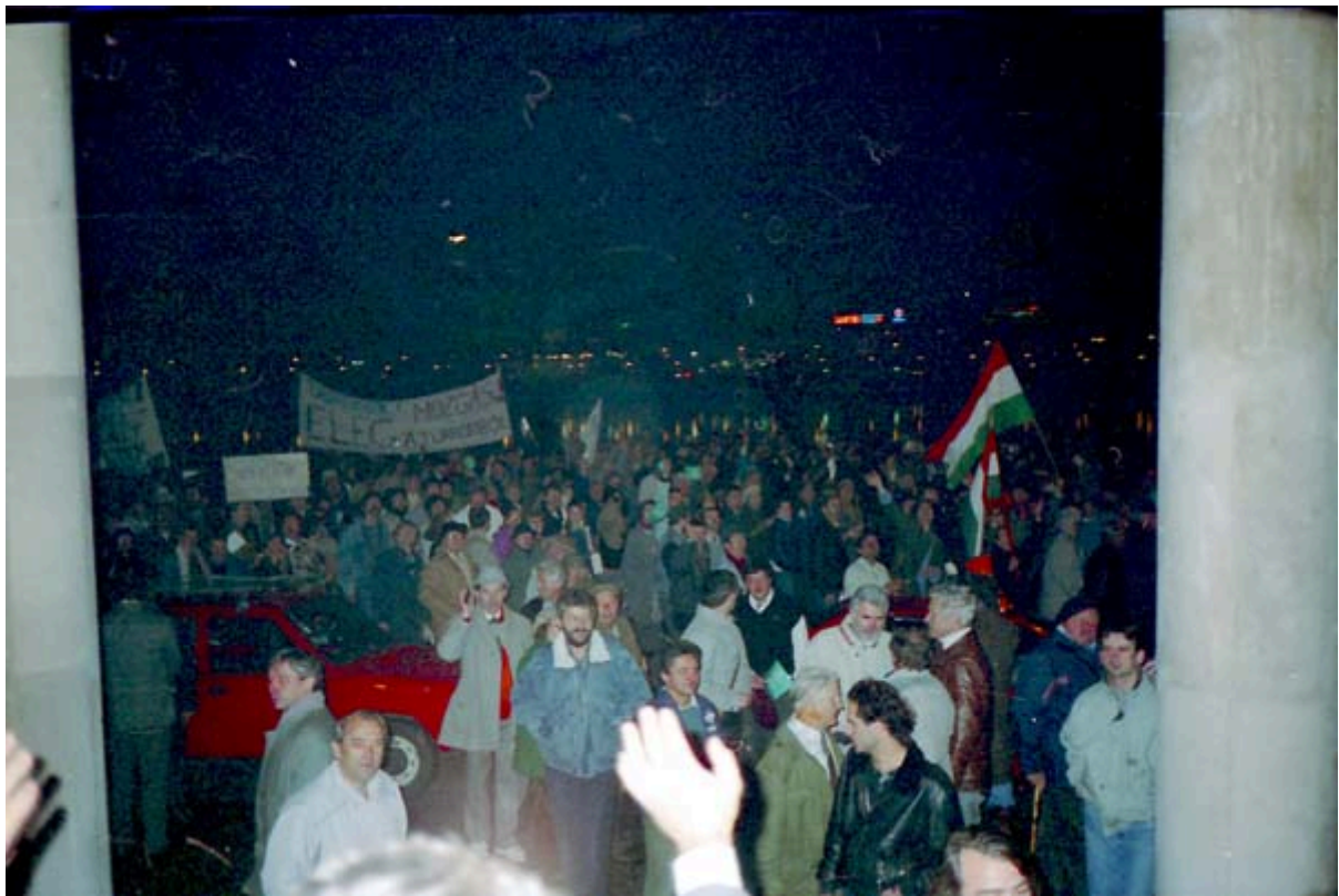
Megérkeznek a kormánypárti tüntetők a Fehér Ház elé